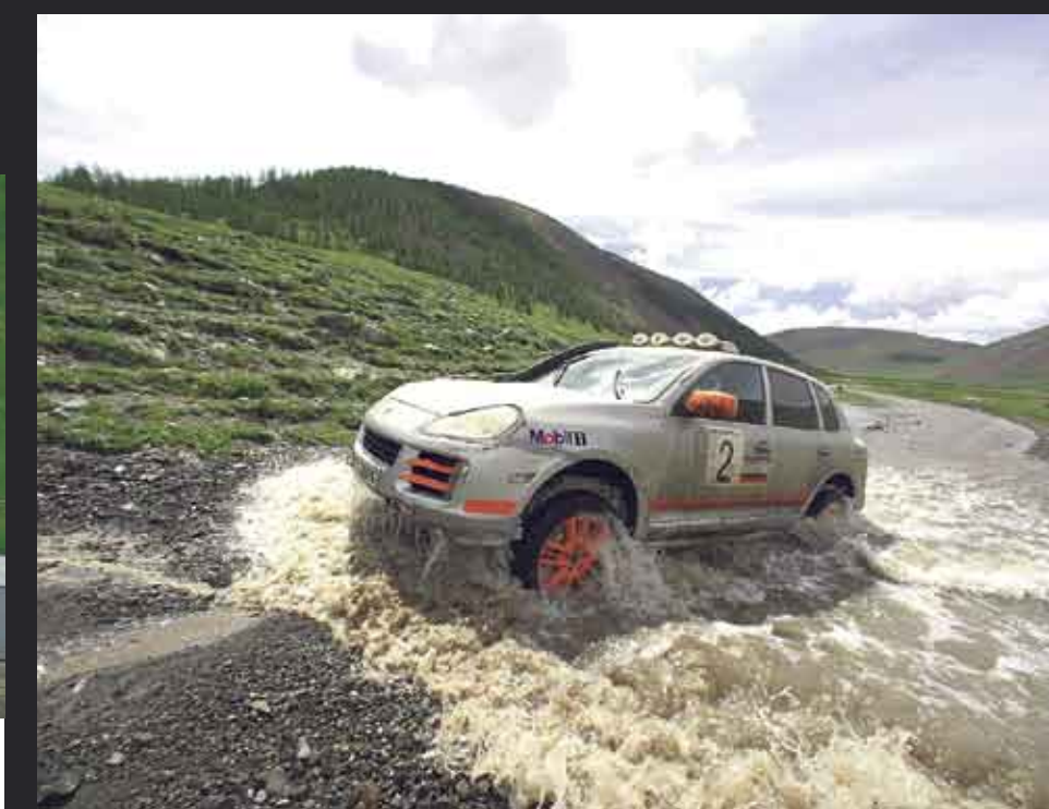
CLASIFICACIÓN TRANSYBERIA 2007

La tradición de Porsche en el deporte del motor de alto nivel acaba de abrir una nueva página de su historia con el Cayenne. El todoterreno deportivo de la firma de Stuttgart ya ha demostrado su capacidad en las más duras pruebas off-road en los más recónditos territorios del planeta.